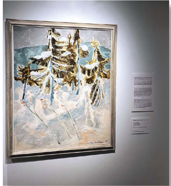
Reidar Särestöniemen Talvimaisema vuodelta 1958 oli esillä Didrichsenin taidemuseon Särestö- niemi -näyttelyssä.