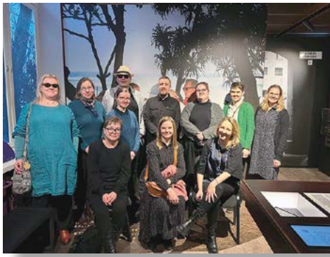
Akseli-konsortiolaiset ryhmäkuvassa Collecte-tietokannan valmistajaistapaamisen merkeissä Idän-suhteiden museo Nootissa Tampereella.