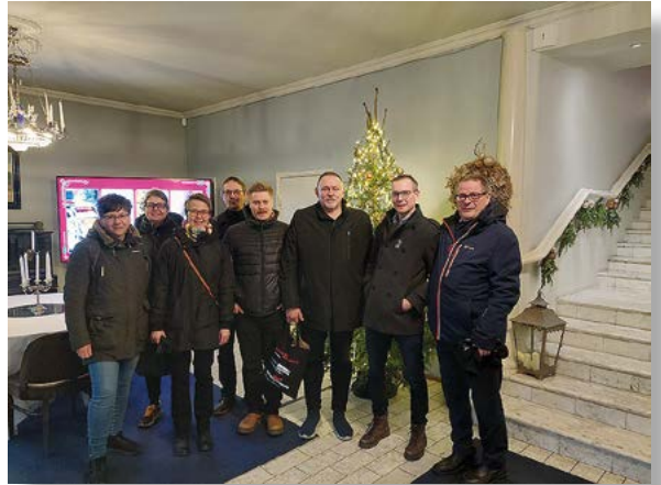
Yksityiset Keskusarkistot ry:n johtajat ryhmäkuvassa pikkujoululounaan merkeissä Kulosaaren Kasinolla.

Toiminnan merkittävimmät riskit ja epävarmuustekijät liittyvät arkiston taloudelliseen epävarmuuteen. Arkiston tuotot laskevat eikä riittävästi rahoituslähteitä ole toistaiseksi löydetty.