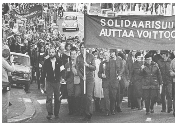
Rauhanmielenosoitus vuonna 1974. Solidaarisuus auttaa voittoa.