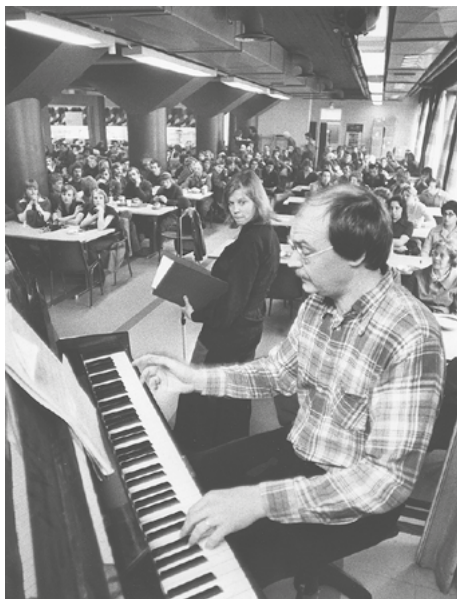
Toinen Helsingin laulufestivaali: Arja Saijonmaa ja Eero Ojanen esiintymässä työpaikkakonsertissa Wärtsilän Hietalahden telakalla vuonna 1977.

Arkistolla oli vuoden päättyessä noin 2 250 seuraajaa Facebookissa ja 1 000 Instagramissa. Facebookissa julkaistiin vuoden aikana 29 ja Instagramissa 14 kertaa. Laajimmalle levinnyt Facebook-päivitys oli 12.12. julkaistu tiedote Tiedonantajan kuva-arkiston luovutuksesta (kattavuus noin 3 700 tiliä). Eniten katseluita (noin 5 800) keräsi 1980-luvun marssikuvista koostunut vappujulkaisu ja eniten vuorovaikutuksia (117) päivitys Arvo Aallon kuolemasta. Instagramin julkaisusta kattavimmaksi muodostui Asunnottomien yönä julkaistu kuva asunnottomista vuonna 1963, jonka näki 433 tiliä. Eniten vuorovaikutuksia (45) keräsivät vappumarssikuvat.