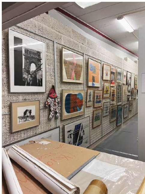
Taidetta säilytettiin myös seinällä Arbetarrörelsens arkiv och bibliotekissa. Näkymä Ruotsin arkiston sisätilasta.