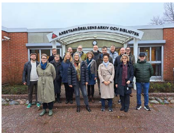
Nordic Institutional Meeting -tapaamisen osallistujat Arbetarrörelsens arkiv och bibliotekin edessä Hud-dingessa, Ruotsissa marraskuussa 2025.