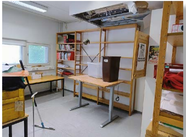
Juuri alkanut kesäloma katkesi yllättäen, kun saatiin tieto vesivahingosta. Aineistovahingoilta vältyttiin, mutta lattian kuivatus ja korjaustyöt venyivät pitkälle syksyyn.